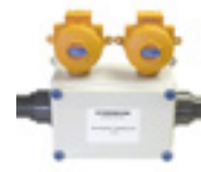
Ventilatorregeling voor de Crowcon Environmental Sampling Unit

Crowcon behoudt zich het recht voor om zonder voorafgaande kennisgeving het ontwerp of de specificatie van het product te wijzigen.