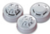
Tot 20 brand-/warmte detectors per zone