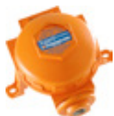
Geluidsalarmen en -lichten